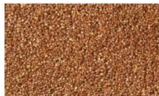
Red Quinoa Husk