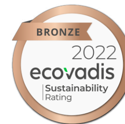
上海工廠首次受評