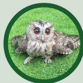
Collared scops owl