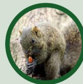
Red-bellied tree squirrel